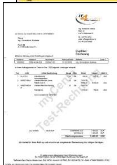
Beispiel-Layout für Rechnungen bzw. Angebote

Für Fragen jeglicher Art stehen wir Ihnen gerne zur Verfügung. Ihre Anfragen richten Sie an office@it4future.at .